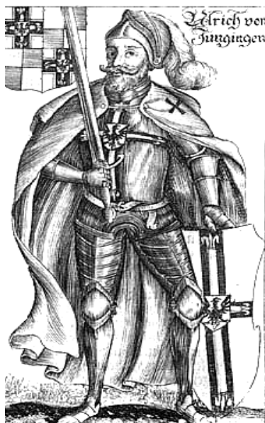
Ulrich von Jungingen

Na podstawie ilustracji i wiedzy pozaźródłowej opowiedz na pytania nr 17, 18, 19, 20, 21, 22, 23